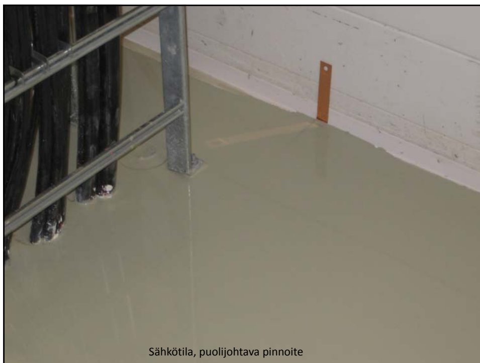
Sähkötila, puolijohtava pinnoite